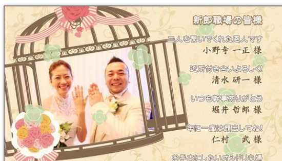
『Birds Wedding』（販売価格¥4,800） デザイン： haseko http://haseko.2box.jp/